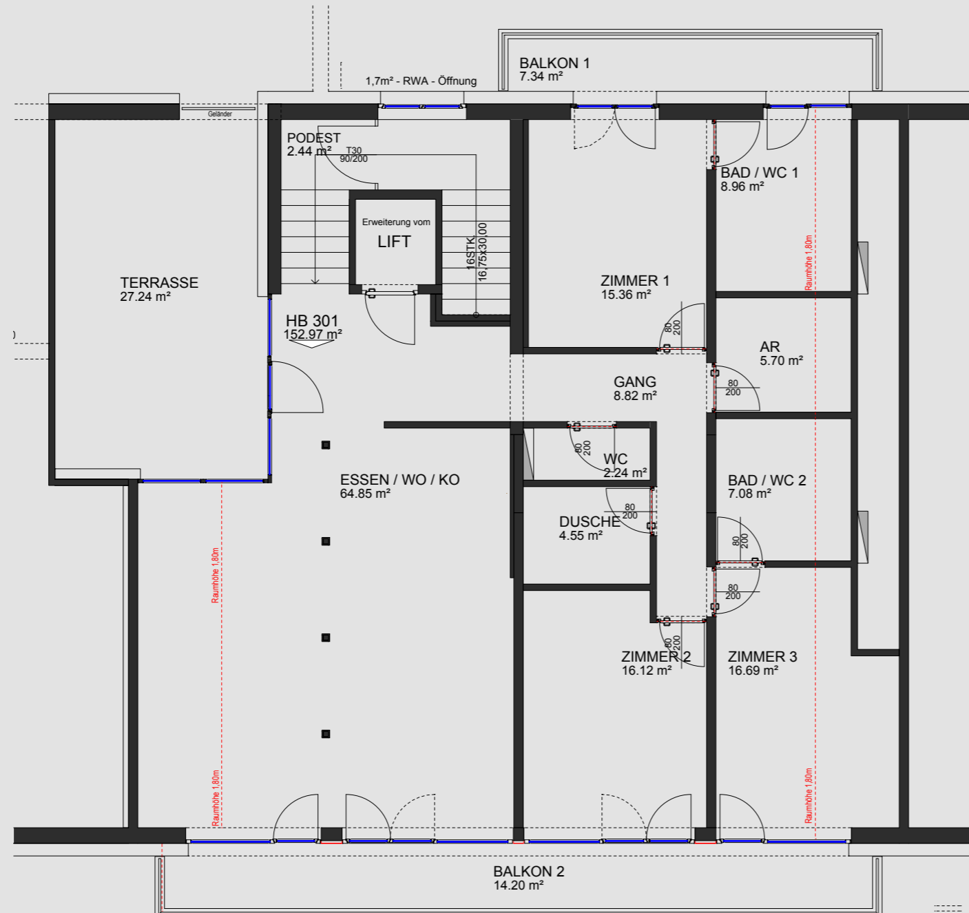
GRUNDRISS M 1:100