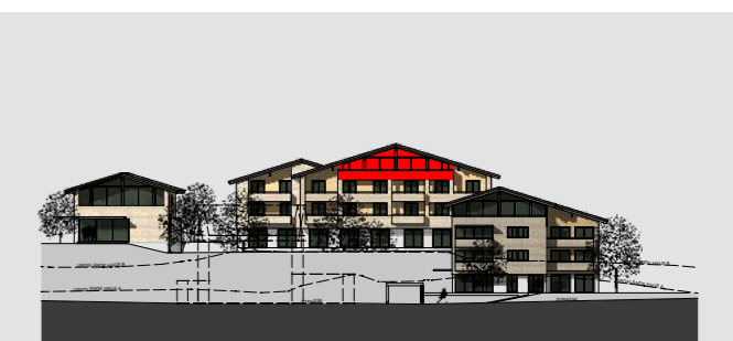
ANSICHT SÜDOST A/B/C M 1:1000