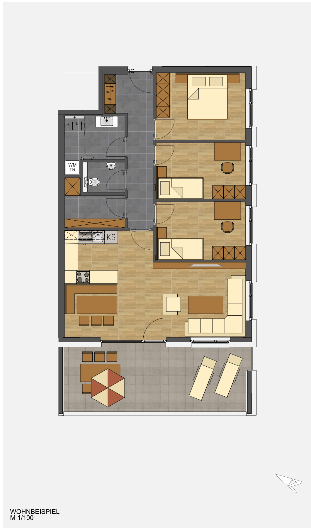
WOHNBEISPIEL M 1/100