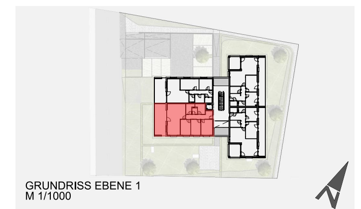
GRUNDRISS EBENE 1 M 1/1000