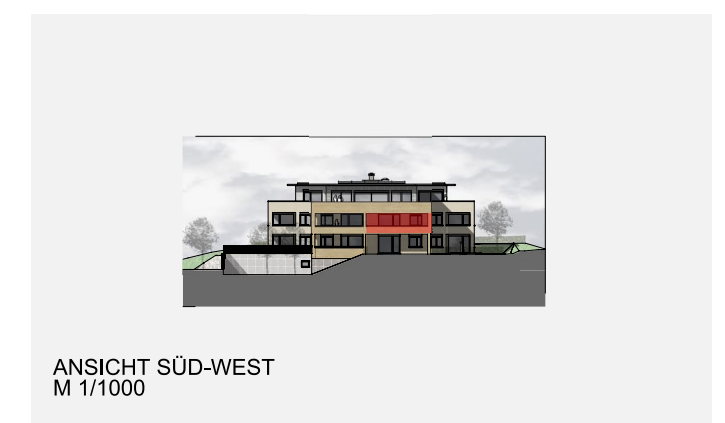
ANSICHT SÜD-WEST M 1/1000