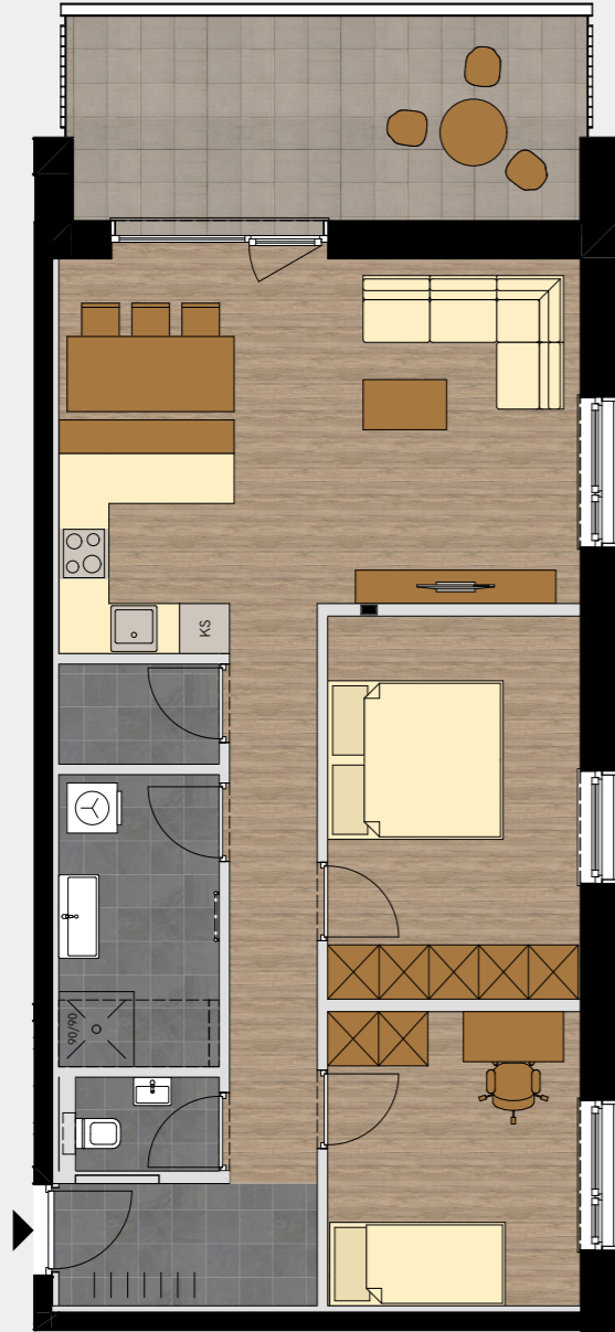
MÖBLIERUNGSBEISPIEL M 1:100