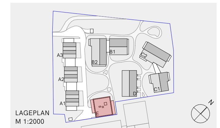
LAGEPLAN M 1:2000