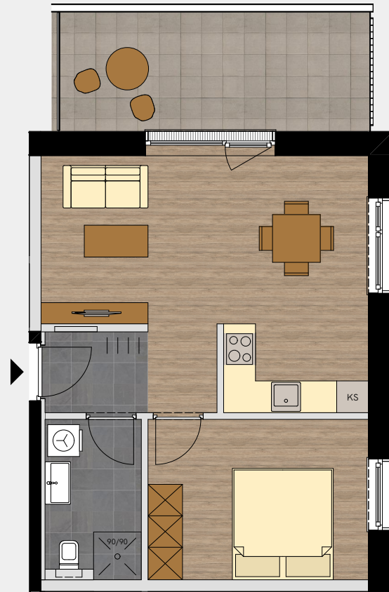
MÖBLIERUNGSBEISPIEL M 1:100