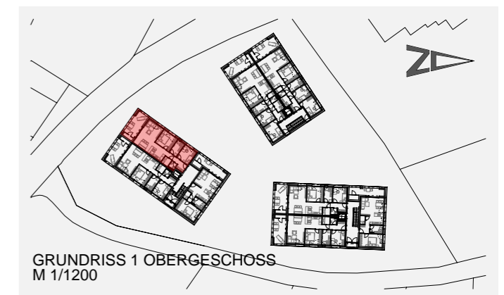
GRUNDRISS 1 OBERGESCHOSS M 1/1200