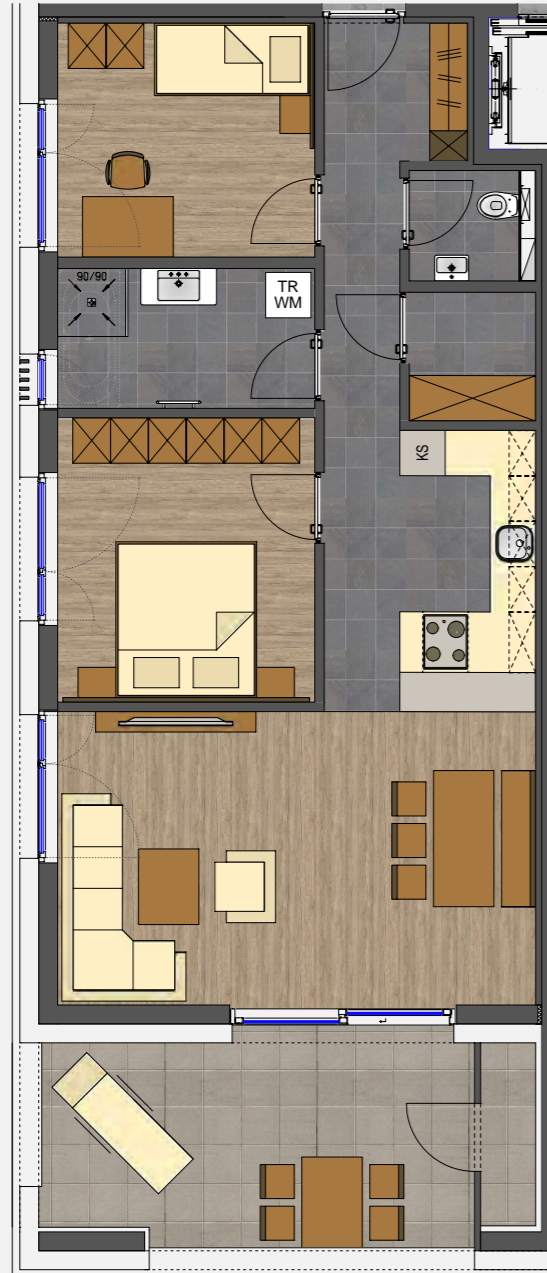
BEISPIEL M 1/100