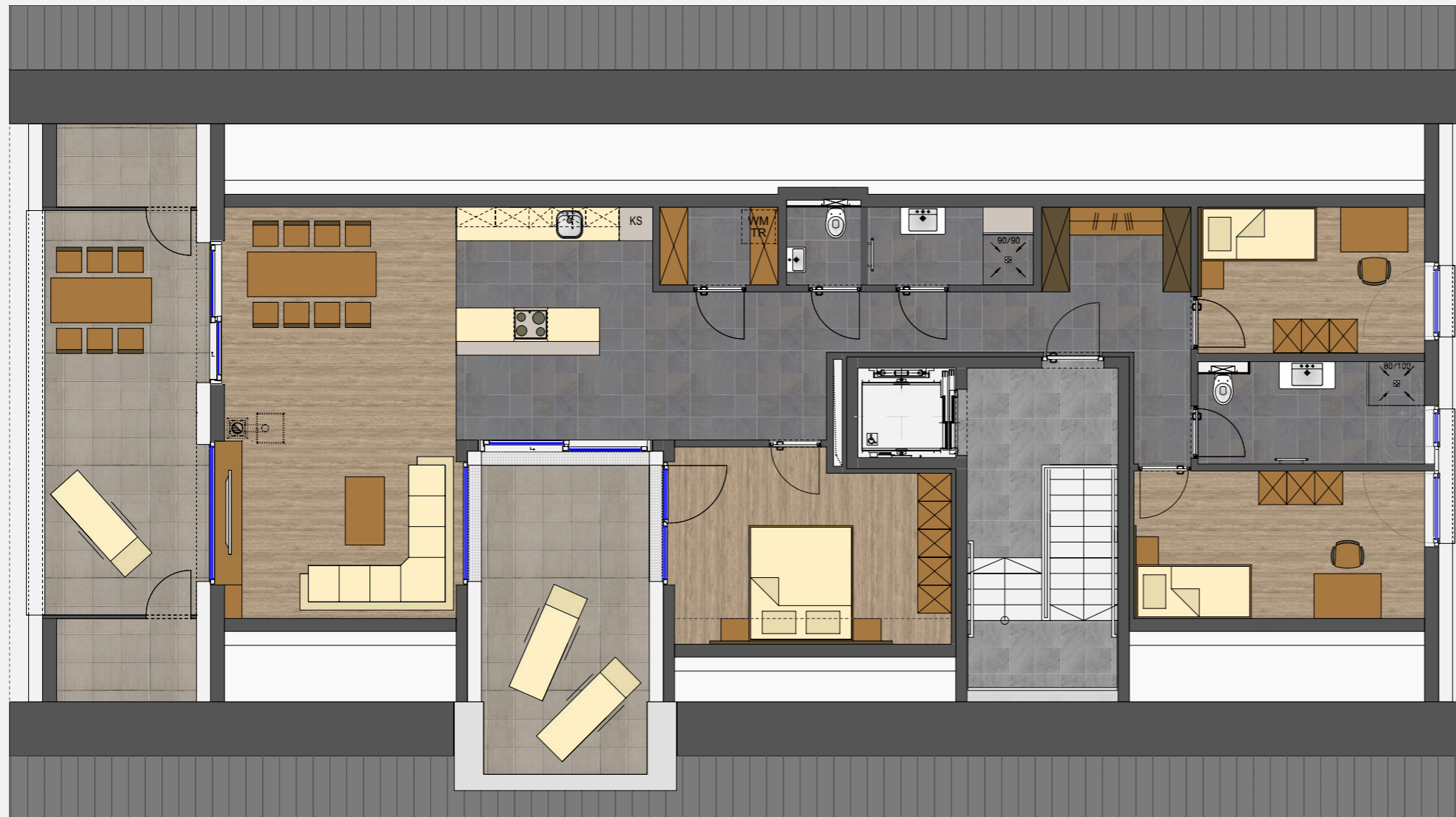
BEISPIEL M 1/100