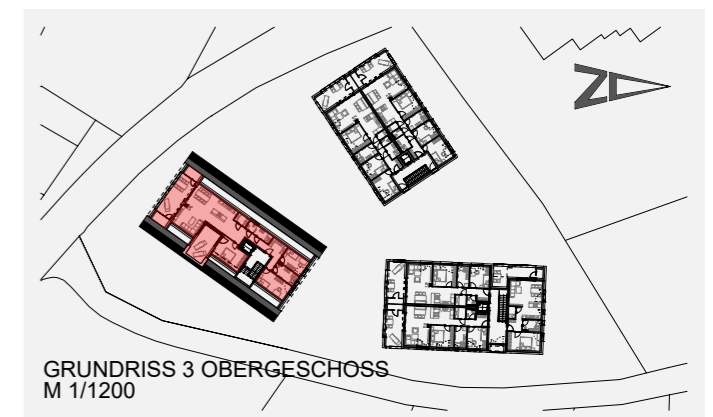
GRUNDRISS 3 OBERGESCHOSS M 1/1200