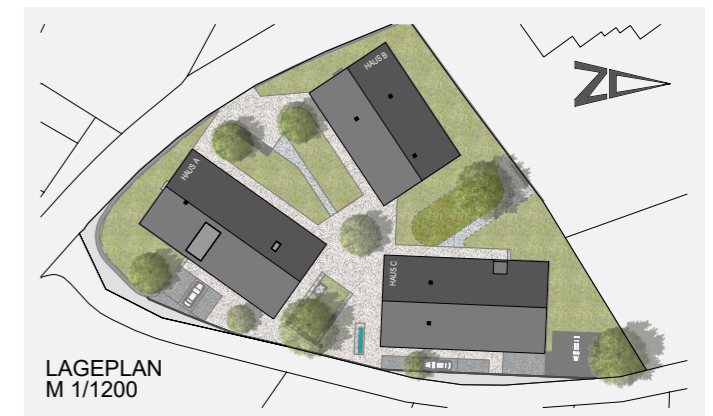
LAGEPLAN M 1/1200